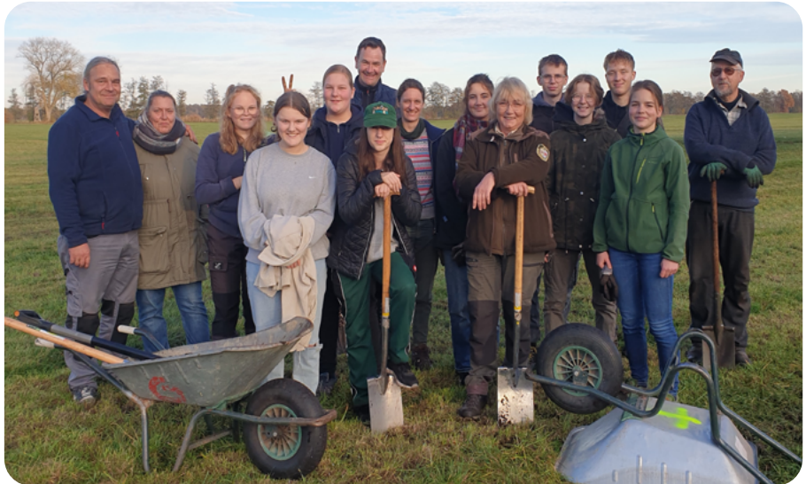
In gemeinsamen Pflanzaktionen entstehen neue Hecken.

Der Förderverein Biosphäre Elbe MV e.V. unterstützt mit seiner Arbeit auch die Partner des Biosphärenreservates dabei, sich im Naturschutz zu engagieren. Dazu stellt er beispielsweise Vogelnistkästen, Wildbienenhotels und insekten- und vogelfreundliche Stauden gegen einen Eigenanteil zur Verfügung und organisiert Pflanzaktionen. Realisiert werden kann dies im Rahmen des Projektes „Netzwerk Biosphäre Elbe artenreich“, einer Fortführung des Projektes „Biosphäre Elbe artenreich“. Das Projekt wird gefördert durch die Deutsche Postcode Lotterie und die Norddeutsche Stiftung für Umwelt und Entwicklung. Aufgrund der Förderung kann die Umsetzung von Naturschutzmaßnahmen zwar nur innerhalb der mecklenburgischen Biosphärenregion unterstützt werden, alle Partnerinnen und Partner sind jedoch