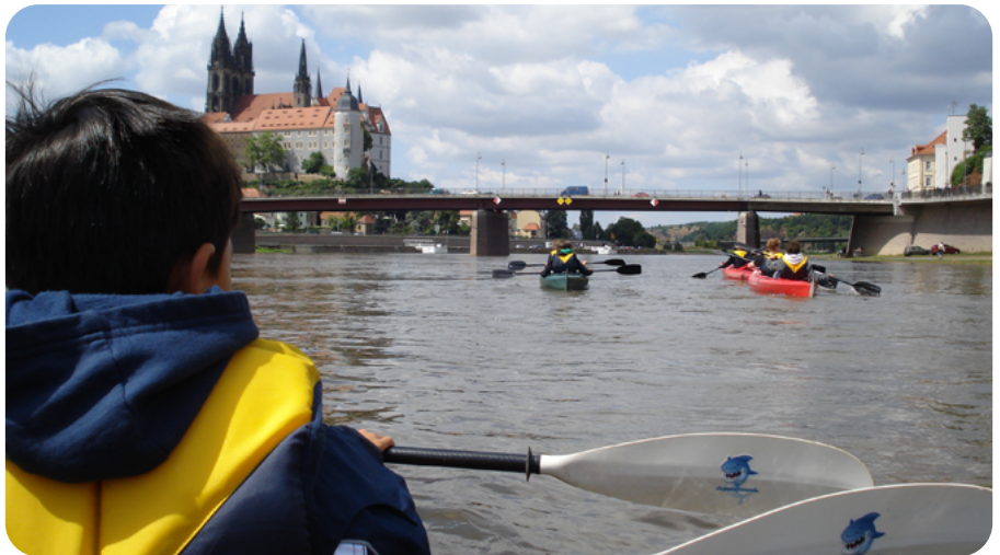
Unterwegs auf dem Wasser