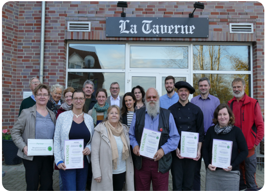
Auszeichnung der Partner in Dömitz