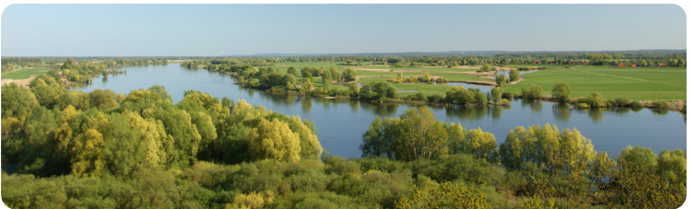
Elbpanorama Frühling bei Boizenburg

Havelberger Naturkostladen unbehandelt; Güldenpfennig & Wollert GbR (Sachsen-Anhalt) Für die bisherige Zusammenarbeit bedanken sich die Biosphärenreservatsverwaltungen sehr!