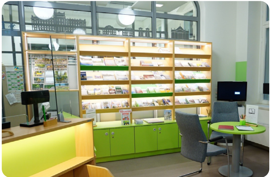
Barrierefrei, geräumig und im Design der Stadt Ludwigslust

Das Team der Ludwigslust-Information, des Stadtmarketings und der Kultur aus der Stadtverwaltung ist am 14. November 2022 nach aufwendiger Sanierung in die neuen Räumlichkeiten umgezogen. Die offizielle Einweihung der neuen Räumlichkeiten der Ludwigslust-Information in der Schloßstraße 41 erfolgte am 30. November 2022 im Rahmen des „Tages der offenen Tür“ und wurde durch Bürgermeister Reinhard Mach feierlich eröffnet. Alle Gäste und Fachleute waren sich einig: Die neue TI wird dem Anspruch einer modernen Tourist-Information nicht nur gerecht, sondern erfährt in dem historischen Gebäude der ehemaligen „Alten Post“ eine repräsentative-, qualitative- und serviceorientierte Nutzungsform. Sie empfängt Touristen mit modernem Mobiliar und neuen Möglichkeiten zur Präsentation von Informationen, Ticketverkäufen und regionalen Souvenirs. Damit ist sie