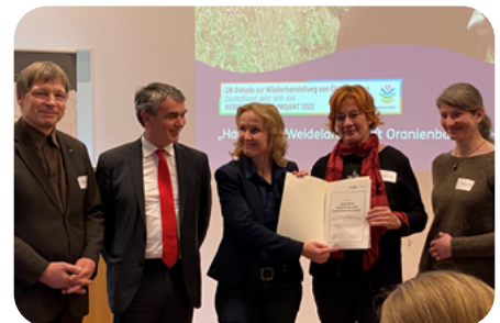
Übergabe der Urkunde durch Bundesumweltministerin Steffi Lemke (3 v.l.)

https://www.undekade-restoration.de/projekte/halboffene-weidelandschaft-oranienbaumer-heide/