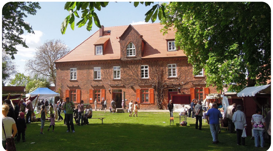
Buntes Markttreiben auf dem Festungshof in Dömitz

Nach drei Jahren der Pause ist es am Sonntag, 23. April, wieder soweit: Die Stadt Dömitz und das Biosphärenreservatsamt Schaalsee-Elbe laden zum länderübergreifenden „8. BiosphäreElbeMarkt“ auf die Festung Dömitz ein! Von 11 bis 17 Uhr bieten über 40 Marktstände, Kunstschaffende und Handwerksleute kulinarische Köstlichkeiten sowie regionale Produkte von Partnern des Biosphärenreservates Flusslandschaft Elbe an. Groß und Klein erwartet ein buntes Kinder-, Führungs- und Bühnenprogramm sowie eine Ausstellungseröffnung. Der Zugang über die historische Zugbrücke auf den Festungs-