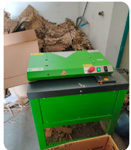
Die neue Verpackungspolstermaschine im Einsatz

gering, allerdings hat sich die Maschine trotz der höheren Kosten nach kürzester Zeit rentiert. Wir versenden ca. 1.500 - 2.500 Pakete / Päckchen pro Monat. Unsere Ausgaben für Verpackungsmaterialien konnten wir dadurch direkt um ca. 75 % senken. Daraus resultieren dementsprechend weniger Abfallkosten der alten Kartonage, welche bei Fahrrädern in größeren Mengen schnell aufkommen. Außerdem können wir auf den Neueinkauf von Verpackungsmaterialien aus Kunststoffen und Folien komplett verzichten, hier verwenden wir nur noch aus Lieferungen erhaltene Polstermaterialien aus Kunststoff für die Mehrfachnutzung.