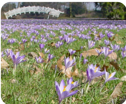
Krokusse im Park