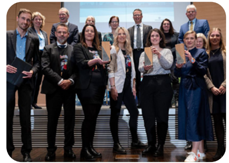
Preisträger Gruppenfoto

denburg überzeugen und wurden mit dem Brandenburger Tourismuspreis ausgezeichnet. Besonders gefallen hat der Jury, dass das Konzept konsequent auf die Zielgruppe ausgerichtet ist und auch dementsprechend kommuniziert wird.